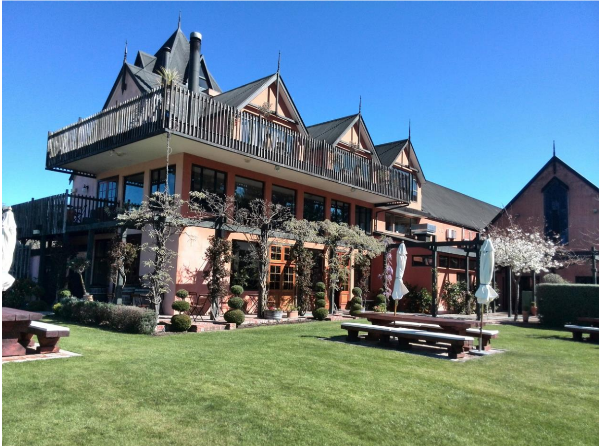
Pegasus Bay restaurant

Pegasus Bay brengt twee lijnen wijn op de markt. De lijn Main Divide omvat wijnen die hoofdzakelijk gemaakt zijn van lokaal aangekochte druiven, geteeld onder hun auspiciën. De wijnen uitgebracht onder de naam Pegasus Bay zijn afkomstig van eigen geteelde druiven. De Pegasus Bay sauvignon/sémillon is tot op heden de witte wijn gebaseerd op hoofdzakelijk sauvignon blanc die de hoogste score ooit van Robert Parker heeft gekregen (95 punten). Maar het is in de rode pinot noir wijnen dat dit domein het best bekend is.